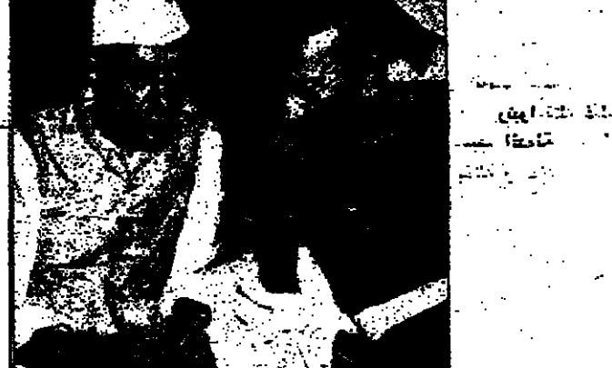
جواهر لال نهرو يصفي الس المهاتما غاندي . وصية من اجل الهند .

قال ماهر : ايه . . . كيف نسيبت . لا ادري ماذا جرى لي اليوم اخشني اني اصبت بسدء النسيان عمرا يا اخي ولا ولا اخذني في احد الايام . . . الكل بسيدر يا شباب ؟؟